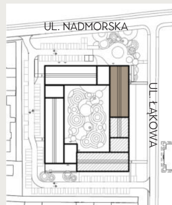
PLAN ZAGOSPODAROWANIA TERENU